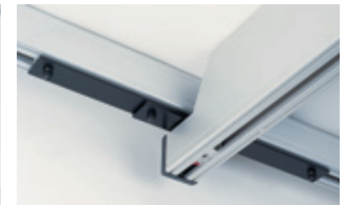
Für grössere raumdeckende Systeme ist ein Hochprofilschiene empfehlenswert. Die optimale Hubhöhe wird durch die Montage einer Hochprofilschiene erreicht.