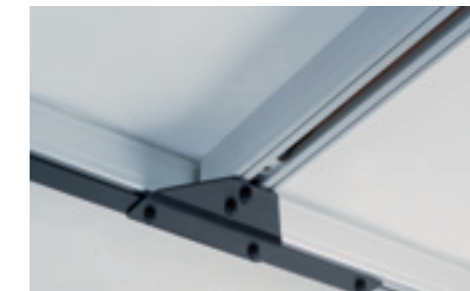
In dem raumdeckenden System kann der Traverschiene zwischen oder unter den Primärschienen montiert werden. Durch Montage zwischen den Primärschienen erfolgt eine optimale Hubhöhe.

Das Schienensystem kann in der Decke, an der Wand oder auf Beinen montiert werden. SL 3000 Deckenlifter bietet alle nötigen Eigenschaften und Details, die die Möglichkeit gibt, das Schienensystem überall zu montieren.