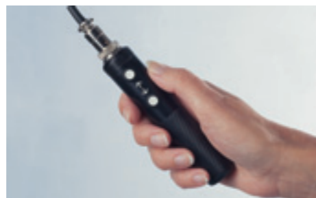
Die Handbedienung kann mit einer Hand leicht betätigt werden

Das Hebegerät wird via ein Stromschienensystem mit 24 V kontinuierlich versorgt – vergessen Sie alles über regelmäßige Aufladung und Ladestationen.