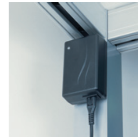
Das vollautomatische Ladegerät gewährleistet Versorgung des Hebegeräts mit 24 V

Das Schienensystem ist mit Stromschienen ausgerüstet. Gleichgültig wo sich das Hebegerät am Schienensystem befindet, wird es kontinuierlich mit 24 V versorgt.