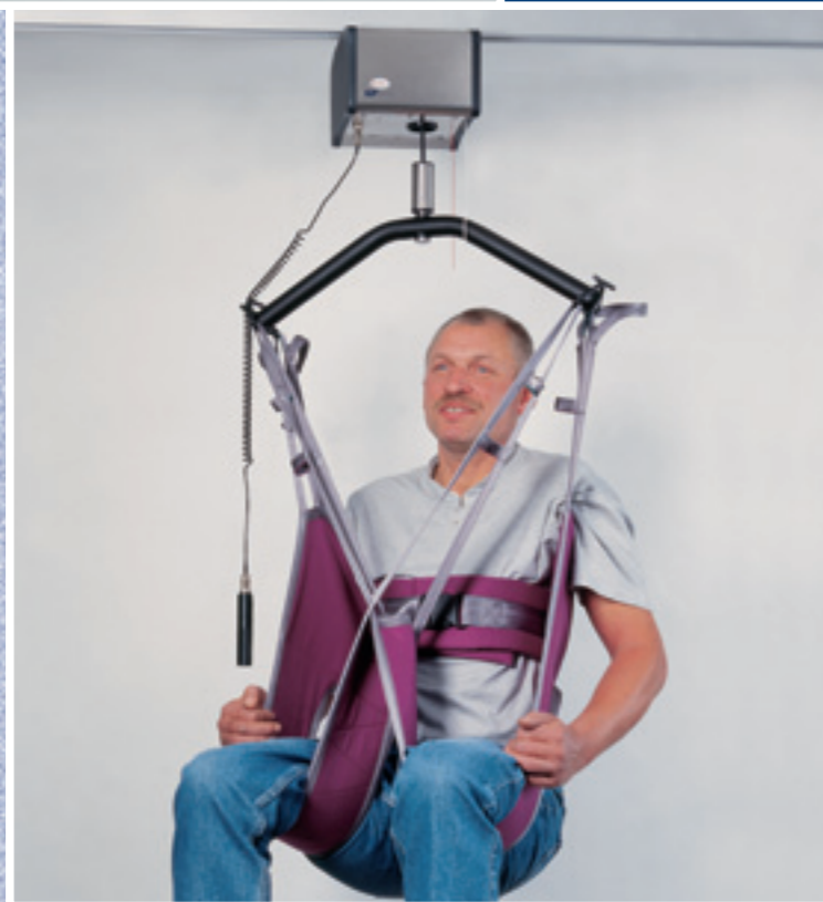
Deckenlifter SL 3000