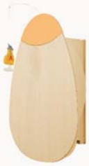
owo owo HPL Marienkäfer